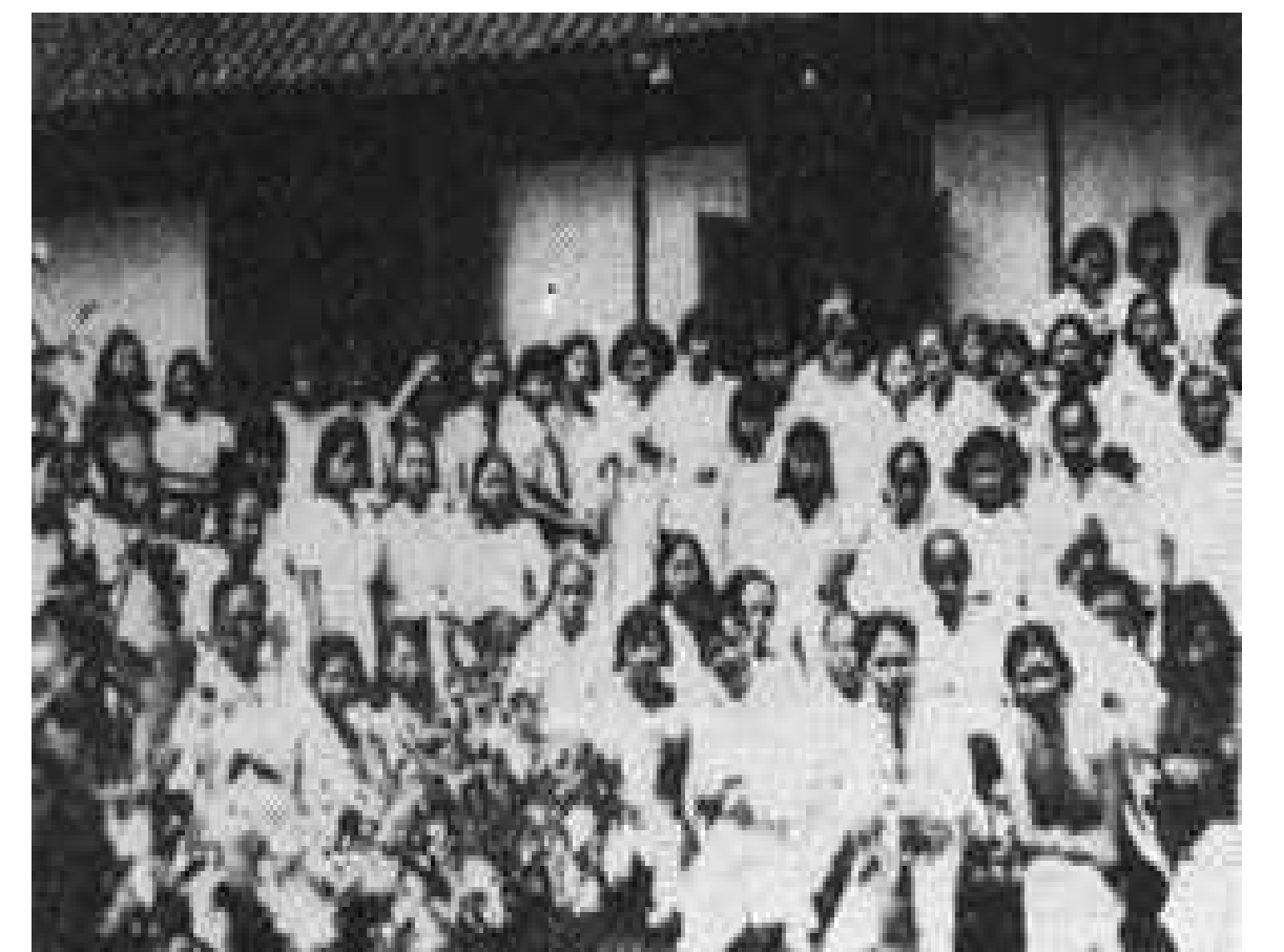
1938年宋尚節與蒙恩者合影