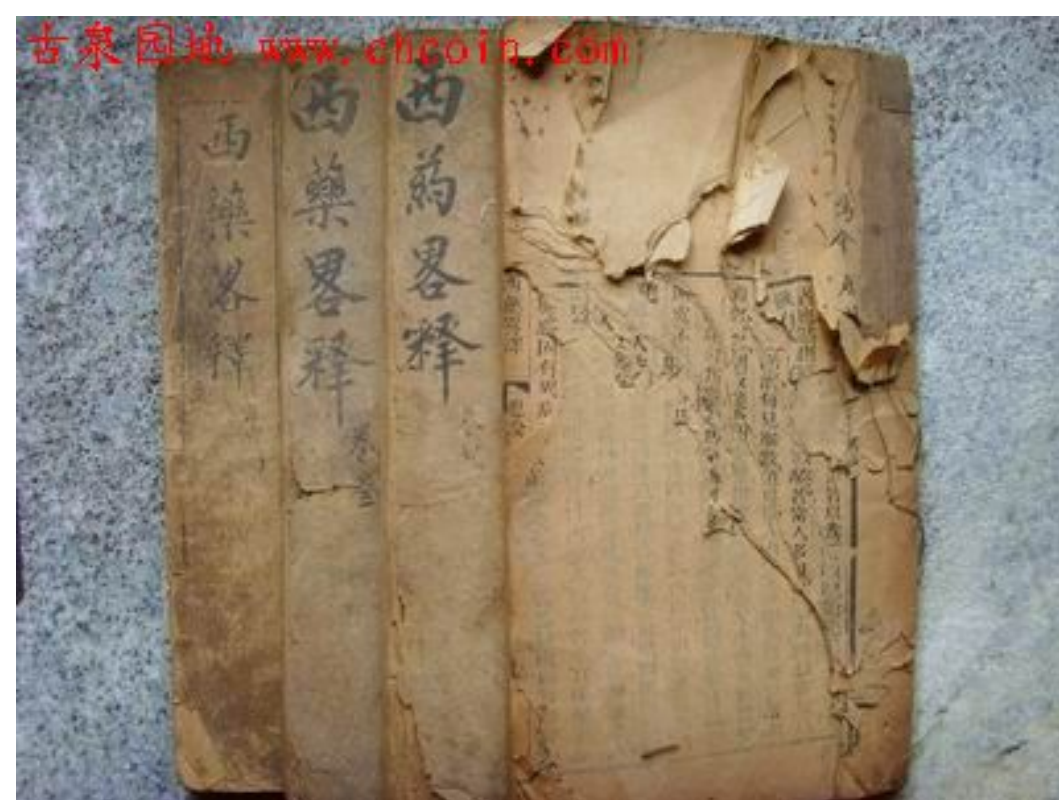
嘉約翰翻譯的西藥略釋