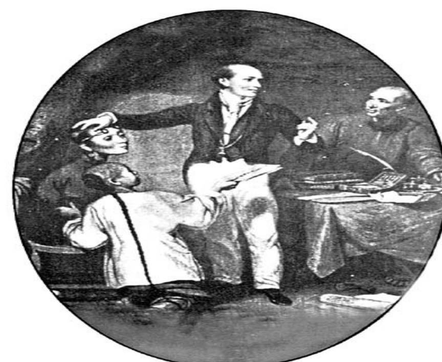
中國首例眼科手術