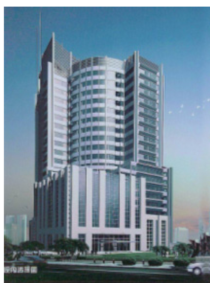
今日的上海第九人民醫院